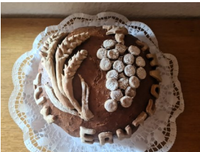
Ernte - Brot Wintersdorf