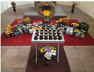
Kriebitzsch mit Bechern für das Abendmahl