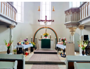
Rositz mit Regenbogen